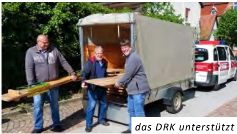
das DRK unterstützt

Schon am Morgen fuhr ein Shuttlebus Wanderwillige hinaus in die Feldgemarkung; viele Teilnehmende kamen aber gleich hinausgelaufen oder -geradelt.