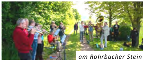
am Rohrbacher Stein

Ein weiterer Impuls an den Drei Linden lenkte den Blick vom Himmel hinab zur Erde, und schon bald fand sich die wandernde Gottesdienstgemeinde in der Poststraße wieder. Hier fand eine Haus- und Taufe auf dem Hof und in der Scheune statt. Das Taufwasser war am Morgen frisch von der Rohrbach-Quelle geschöpft worden.