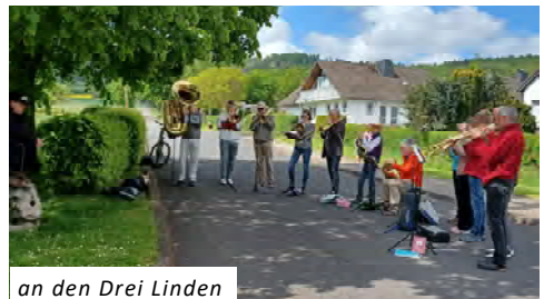
an den Drei Linden

Der Zierenberger Posaunenchor empfing die Ankommenden zwischen leuchtenden Rapsfeldern und herrlichem Maigrün mit fröhlichen Klängen. Nach einem Startimpuls ging es auf den Weg und zugleich auf die Suche nach himmlischen Momenten im eigenen Leben.