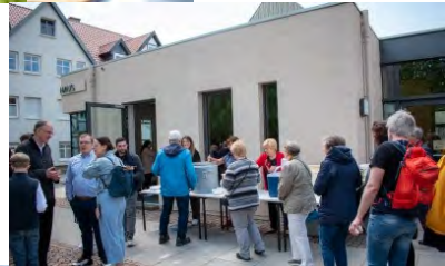
Gemeinschaft beim Essen

An der Stadtkirche gab es schließlich den Schlussimpuls und den Segen, bevor zum Essen im Kirchgarten eingeladen wurde. Hier konnte bei leckerer Linsensuppe mit Würstchen und einem bunten Kuchenbuffet bei Sonnenschein und bester Stimmung geschlemmt werden. Die Ev. Jugend lud die Kinder zum Kinderschminken, Seifenblasen und frischem Popcorn ein. Spiel und Spaß waren so auch für die Kleinsten garantiert.