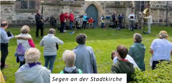
Segen an der Stadtkirche