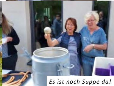
Es ist noch Suppe da!

An der Stadtkirche gab es schließlich den Schlussimpuls und den Segen, bevor zum Essen im Kirchgarten eingeladen wurde. Hier konnte bei leckerer Linsensuppe mit Würstchen und einem bunten Kuchenbuffet bei Sonnenschein und bester Stimmung geschlemmt werden. Die Ev. Jugend lud die Kinder zum Kinderschminken, Seifenblasen und frischem Popcorn ein. Spiel und Spaß waren so auch für die Kleinsten garantiert.