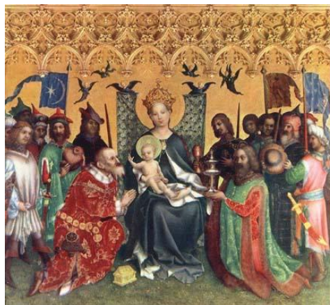
Heinrich Heine meinte das berühmte Dombild von Stefan Lochner

Es schweben Blumen und Eng'lein Um unsre liebe Frau; Die Augen, die Lippen, die Wänglein, Die gleichen der Liebsten genau.